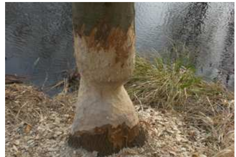
Die Spuren des Bibers sind im Königsfließ für den aufmerksamen Beobachter nicht zu übersehen. Ob Baumeister Biber hier auf Dauer Revier bezieht, wird sich in den nächsten Jahren zeigen.

Ihre Waldflächen hat die NABU-Stiftung aus der forstwirtschaftlichen Nutzung genommen und der Naturentwicklung überlassen. Die Stiftungswälder entwickeln so eine eigene Dynamik durch Werden und Vergehen. Alt- und Totholz dient ausschließlich als Lebensgrundlage einer Vielzahl von Tieren, Pflanzen, Pilzen und Flechten.